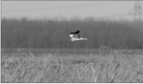
Blauwe kiekendief, foto Metje van Tongeren

In alle seizoenen van het jaar plannen we excursie naar bestemmingen elders in den lande (zie o.a. IJmuiden en het Lauwersmeer), maar laten we daarbij vooral niet de schoonheid en waarde van onze eigen vogelregio vergeten! Deze excursie is een mooie gelegenheid om op zoek te gaan naar leuke vogelsoorten dicht bij huis en om misschien nieuwe gebieden in onze eigen omgeving te leren kennen. Het exacte programma van deze dag is nog niet bekend, maar gebieden als de Oostvaardersplassen, het Vossemeer/Ketelmeer en de Polder Oosterwolde behoren zeker tot de mogelijkheden. Je kunt je voor deze dagtocht opgeven bij Benno van den Hoek ( bennovdhoek@hotmail.com of 06-12192978).