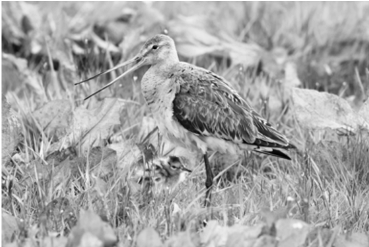
Grutto met kuiken

schap nat en open blijft. Geen bomen, houtsingels, bosjes, prefab ooievaarsnesten en heuveltjes als basis voor predatoren. Uitzondering: bij een overmaat aan vossen vragen we een ontheffing voor afschot. ” Kortom, wij moeten wat telooftaat door te intensieve landbouw niet compenseren door op een natuuronvriendelijke manier Grutto's te kweken.”