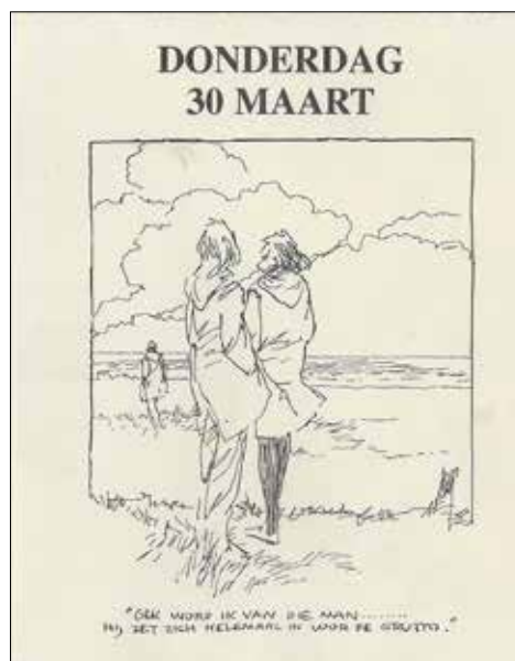
Uit de Peter van Straaten kalender

Kijk ook op de website: www.nieuweveluwe.nl