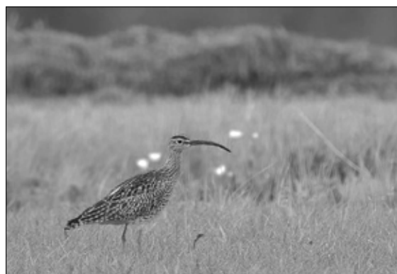
Regenwulp, foto Rini Lamboo

Met 135 soorten en aardig wat missers (écht, we kunnen beter...) lijkt 140 in de toekomst zeker haalbaar. Iets beter scoren op de 'vaste' basissoorten en je bent er eigenlijk al. Een heuse prestatie lijkt dat overigens wel, ook landelijk gezien. Ter referentie: het Gelderlandse BigDay-record is dit jaar verbroken en komt uit op 'slechts' 150. En dat is 24 uur, met de auto, door heel Gelderland. Nog een referentie dan: de