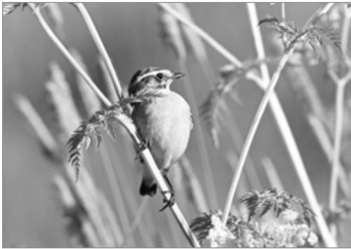
Een pleisterend Paapje van Afrika verder Europa in

Grutto's 'vliegvlug' worden. Maar het aantal is alleen maar verder gedaald, met vooral 2015 als een dramatisch slecht gruttojaar. Niet meer dan 4600 jongen werden er vorig jaar groot. Momenteel staat de teller op nog maar 32.000 paren.