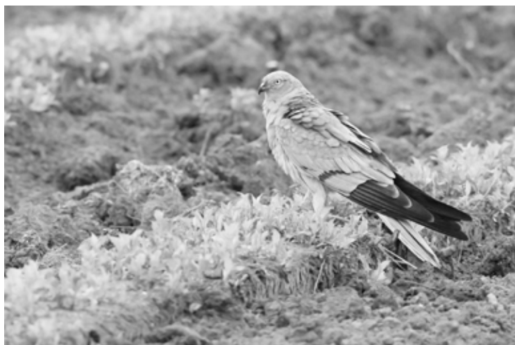
Grauwe kiekendief man

Naast een leuke hoeveelheid doortrekkende Rode wouwen werden er dit voorjaar ook regelmatig 1-2 vogels gezien in de nabijheid van Landgoed Staverden. Deze broedverdachte vogels werden ook vorig jaar daar gezien, maar verder is er weinig over bekend (gemaakt). Zekere broedgevallen van deze soort worden in Nederland om begrijpelijke redenen (verstoring en zelfs vervolging) geheim gehouden. Ook Waarneming.nl houdt hier met gericht beleid rekening mee, door alle waarnemingen in die gebieden af te scherpen.