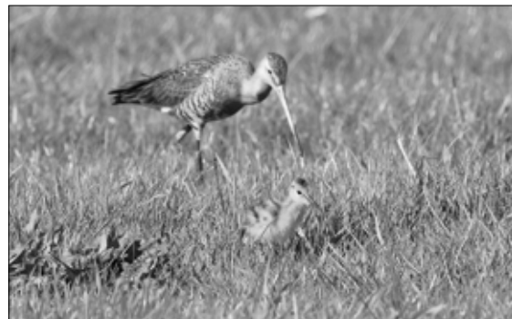
Voedselzoekend Gruttokuiken met ouder

Als je op deze manier door Arkemheen struint, zou je denken dat het combineren van melkvee en weidevogels zo moeilijk niet is. Toch is het vijf voor twaalf voor onze Grutto, Kievit en Tureluur. Wat veroorzaakte de spectaculaire opkomst en later de nog snellere neergang van de Nederlandse weidevogels? Doordat wij vanaf de tweede helft van de negentiende eeuw onze natte wei- en hooilanden minder schraal en ruig maakten, namen hun aantallen gestaag toe. Weidevogels werd de verzamelaar voor de vogels die het een eeuw lang in onze natte boeren-graslanden beter hadden en deden dan in de wildernis. Watersnip, Kemphaan en Zomertaling piekten al tachtig jaar geleden in aantal. Daarna werd het minder doordat de landbouw intensiverde en de nat-