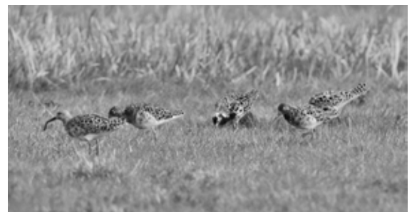
Groepje foeragerende Kemphanen